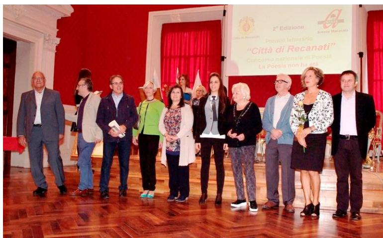
Foto di alcuni poeti e autorità