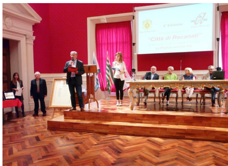
Foto di momenti della premiazione